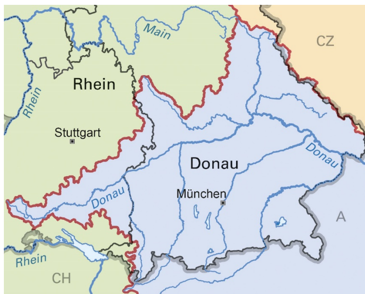
Abbildung 1: Übersicht über das deutsche Donaueinzugsgebiet

Das deutsche Donaueinzugsgebiet umfasst eine Fläche von 56 200 km 2 , sein Anteil am Gesamteinzugsgebiet der Donau beträgt ca. 7 %. Der baden-württembergische Flächenanteil hat eine Gesamtgröße von ca. 8.050 km 2 , der bayerische von ca. 48.200 km 2 . Die Donau beginnt am Zusammenfluss von Brigach und Breg, durchfließt dann auf einer Länge von knapp 200 km Baden-Württemberg bis sie bei Ulm die Landesgrenze überschreitet und anschließend rund 400 km auf dem Gebiet des Freistaates Bayern fließt. Ab der Einmündung der zum Main-Donau-Kanal ausgebauten Altmühl bei Kelheim ist die Donau Bundeswasserstraße und auf einer Länge von 213 km bis zur Staatsgrenze nach Österreich für große Binnenschiffe befahrbar.