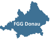
Bewirtschaftungsplan deutsches Donaugebiet – Karte 2.3