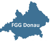
Bewirtschaftungsplan deutsches Donaugebiet – Karte 2.7